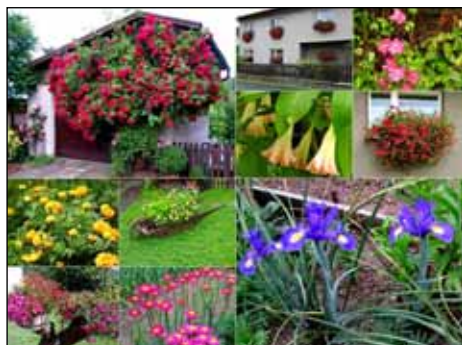
1. místo: Miroslava Španihelová

Už nyní se budeme těšit na příští ročník a doufáme, že v dalších letech bude soutěžních fotografií přibývat. Ať nám Horní Bečva jen vzkvátá.